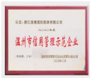
温州市信用管理示范企业