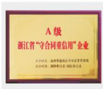
A级 浙江省“守合同重信用”企业