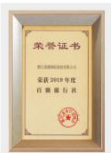
2019年度浙江省百强旅行社