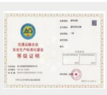
交通运输企业安全生产标准化建设等级证明