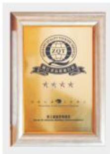
浙江省四星品质旅行社