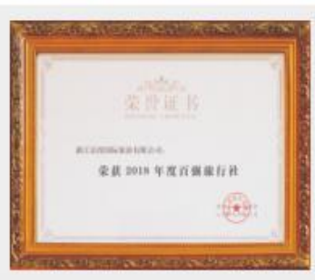
2018年度浙江省百强旅行社